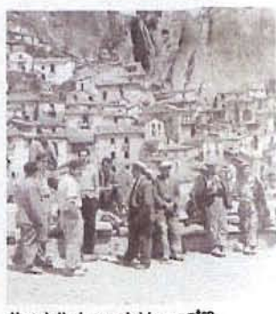
Una delle immagini in mostra